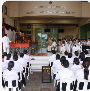
พิธีบูชาบรมครูฯ และไหว้ครู