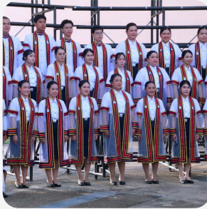
พิธีรับพระราชทาน ปริญญาบัตร