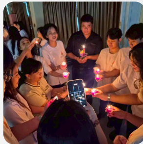
พิธีจุดเทียน ภูมิปัญญา