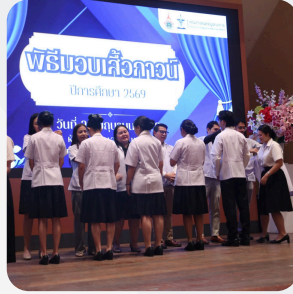
พิธีรับเสด็จกษัตริย์